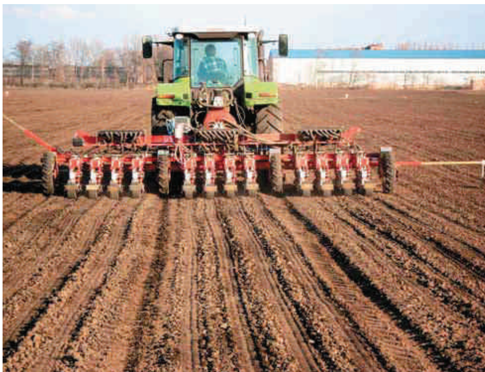
«Агрикола» на посеве свеклы

При обработке полей, предназначенных для выращивания свеклы на хранение, необходимо учитывать, что период от посева до уборки многих сортов и гибридов составляет около 100 дней. Известно, что перезревшая свекла хранится плохо, и по этой причине сдвигают сроки посева на более