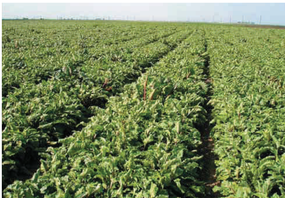
Поле свеклы компании «Лукойл-Каскара» в Тюменской обл.

При определении глубины посева не следует руководствоваться рекомендациями, выраженными в сантиметрах, самое главное, чтобы семена ложились на устойчиво влажный слой почвы. Для свеклы этот показатель больше, чем для других овощных культур. Семя у свеклы представляет собой клубочек с 1-3 зародышами, и, чтобы не снижать товарность корнеплода, расстояние в ряду между семе-