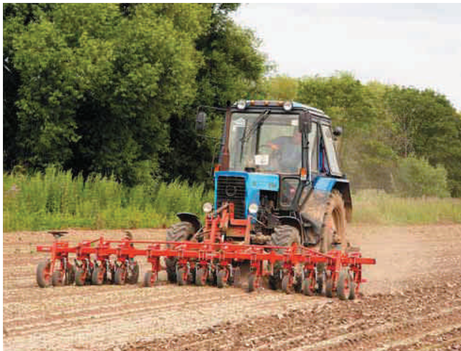
Междурядная обработка посевов свеклы «Стекете»

вать дозу 3,0 л/га, при этом культура должна иметь 4 настоящих листа. Позже вносить гербицид бессмысленно.